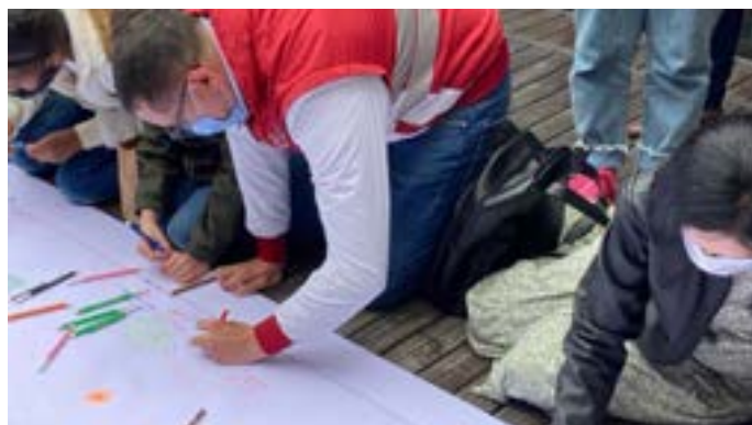
Foto: Personería de Bogotá, D. C., Centro de Memoria, Paz y Reconciliación. Septiembre de 2021

Equipo Implementador. Estuvo conformado por la Secretaría Distrital de Salud (SDS); la Secretaría Distrital de Cultura, Recreación y Deporte (SDCRD); la ACPVR; Centro de Memoria, Paz y Reconciliación (CMPR); Instituto Distrital de la Participación y Acción Comunal (IDPAC); Instituto Distrital para la Protección de la Niñez y la Juventud (IDIPRON); Instituto Distrital de las Artes (IDARTES); y el Instituto Colombiano de Bienestar Familiar (ICBF) Regional Bogotá. Cabe señalar que durante el año 2020 no se realizaron encuentros con los NNA, debido a las restricciones de reunión establecidas como medidas de prevención ante la pandemia y las limitaciones en el acceso a la virtualidad. Por lo anterior, en dicho año no se contó con discusiones y propuestas por parte de los NNA víctimas en Bogotá, D. C.