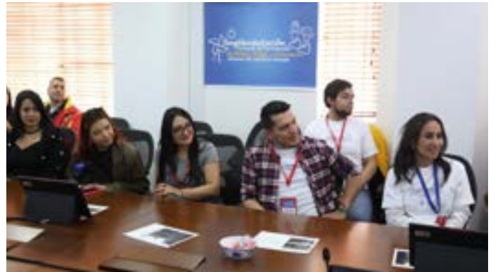
Foto: Personería de Bogotá, D. C., carrera 7 No. 21-24, noviembre 2023.

Cabe señalar que, en los ejercicios realizados durante 2023 no se planeó la participación de las entidades. Por lo anterior, la incidencia de estas propuestas serán las acciones que se realizarán durante el año 2024, esperando que sean incluidas en el PAD por parte del equipo de la ACPVR que está a cargo de dicho proceso.