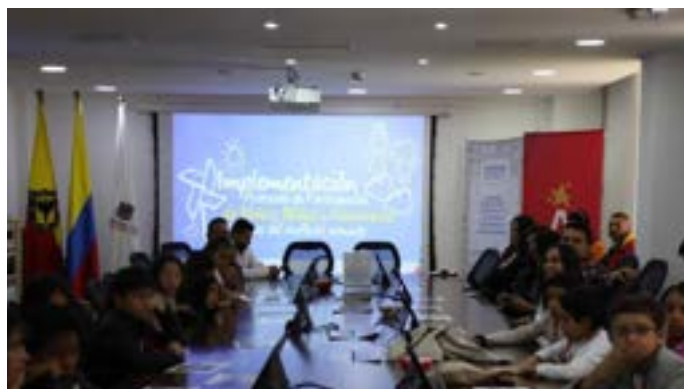
Foto: Personería de Bogotá, D. C., carrera 7 No. 21-24, noviembre 2023.

Al finalizar el año 2023, la Personería de Bogotá, D. C., la ACPVR y la SDIS, realizaron un encuentro con NNA de los procesos de Atrapasueños y del IDPAC/ACPVR, denominado Conversaciones para el cambio: los niños, niñas y adolescentes víctimas toman la palabra .