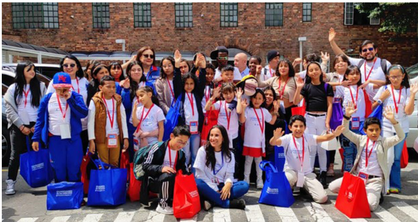
Foto: Personería de Bogotá D.C., carrera 7 No. 21-24, noviembre de 2023