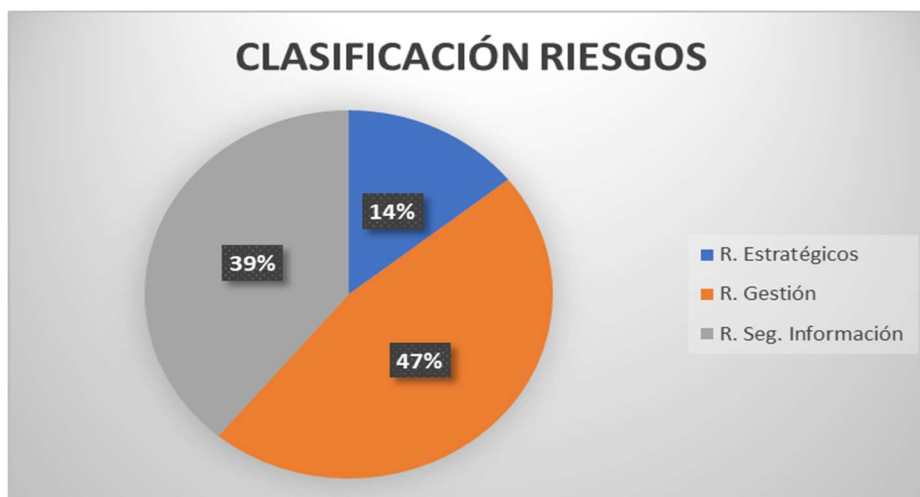
Gráfico No. 2. Clasificación Riesgos – elaborado por la OCI