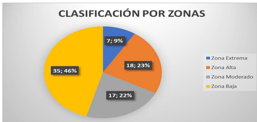
Gráfico No. 3. Riesgos por procesos y su valoración por Zona - elaborado por la OCI

A continuación, el Gráfico No. 3 representa que de un total de setenta y siete (77) riesgos identificados, el 9% se encuentra en zona de riesgo extrema, el 23% en zona de riesgo alta, el 22% en zona de riesgo moderado y el 46% en zona de riesgo baja: